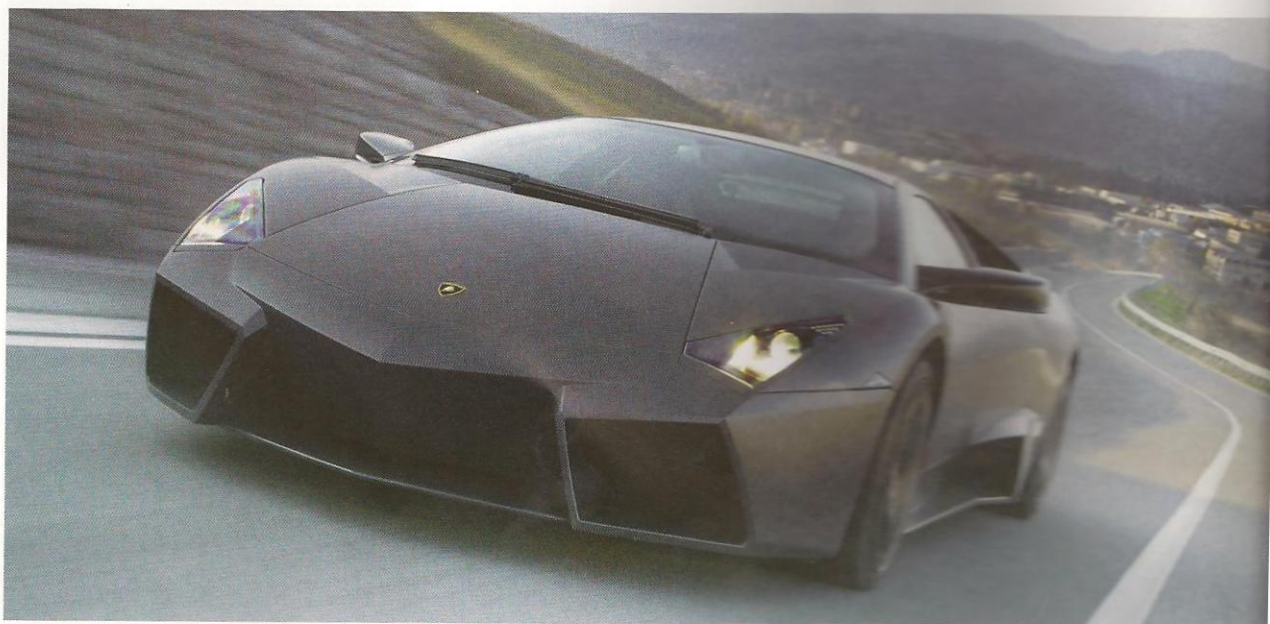
O "Reventon", da Lamborghini, custa mais de 2 milhões de reais.