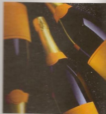
Um champanhe da Veuve Clicquot chega a dois mil dólares a garrafa.